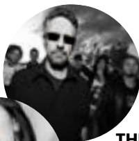
THE BOX GROUPE LÉGENDAIRE